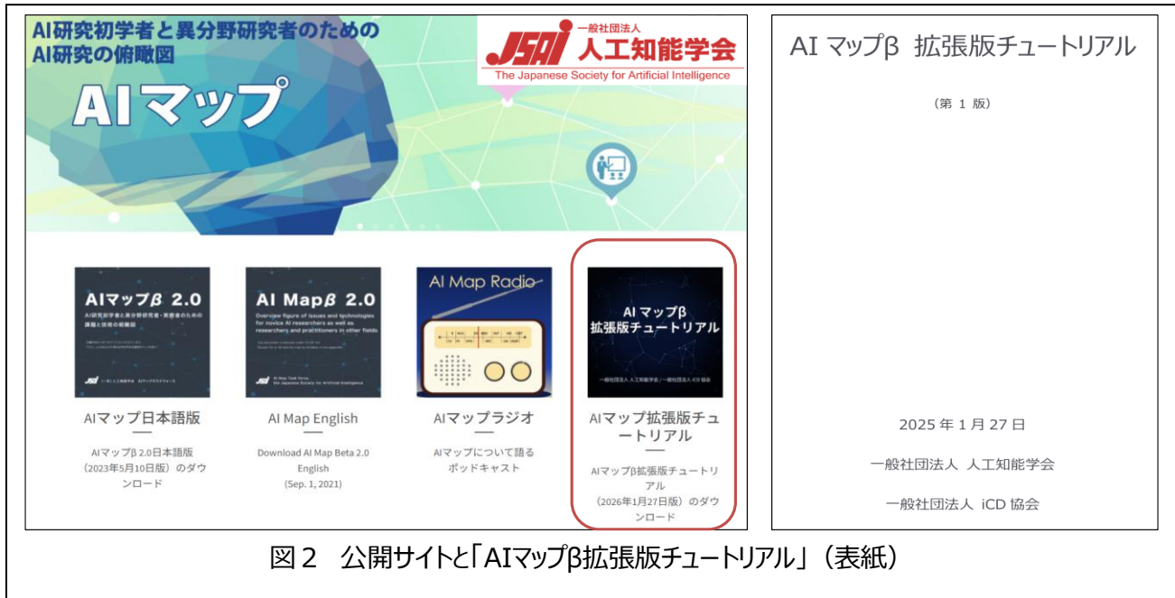
図2 公開サイトと「AIマップβ拡張版チュートリアル」(表紙)